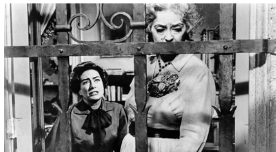
What ever happened to Baby Jane?, film de Robert Aldrich, 1962

Au retour d'un cocktail bien arrosé, durant lequel Jane s'était montrée particulièrement odieuse avec sa sœur, Blanche a tenté, dans un coup de sang, d'écraser sa sœur en fonçant sur elle à toute allure.