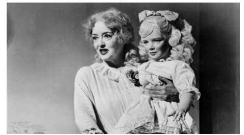
What ever happened to Baby Jane?, film de Robert Aldrich, 1962

Arrivée à l'âge adulte, la carrière de Jane s'effondre et elle est oubliée du public.